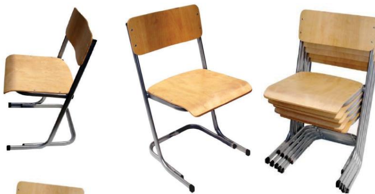
Прилог бр.3 Фотографија столице